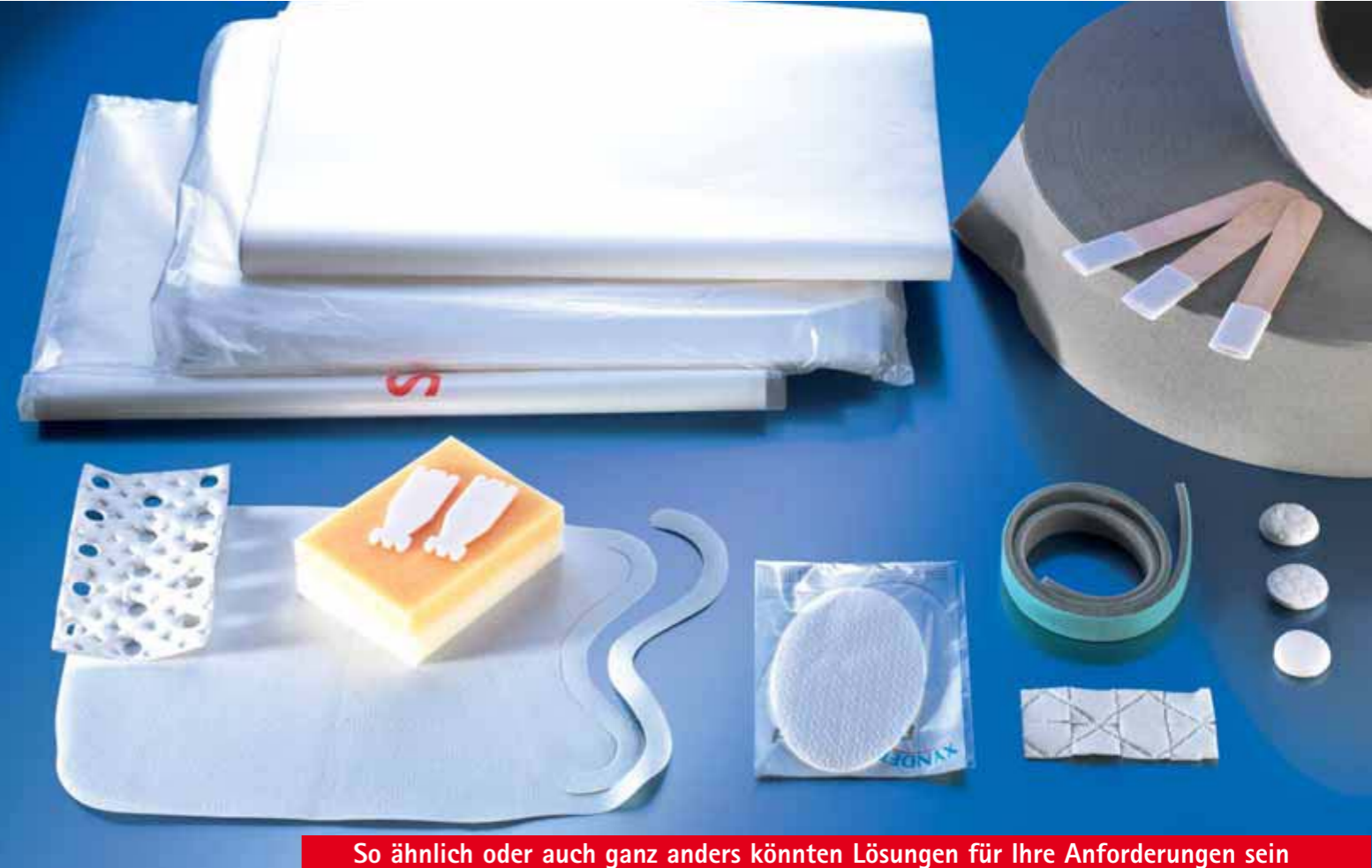
So ähnlich oder auch ganz anders könnten Lösungen für Ihre Anforderungen sein