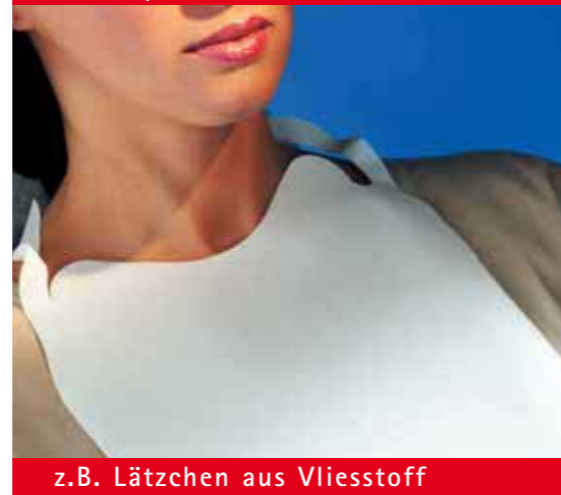
z.B. Lätzchen aus Vliesstoff